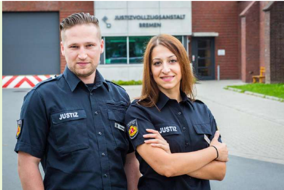
Figura 2 Ofițer corecțional la închisoarea Bremen, Germania

obișnuite de dezvoltare a carierei pentru moment. Aceste practici includ evaluările anuale ale performanței și alte tipuri de reuniuni de evaluare a carierei. Revizuirea anuală a performanței este principalul instrument pe care un gardian îl poate folosi pentru a-și avansa cariera și pentru a-și înrola superiorul în demers.