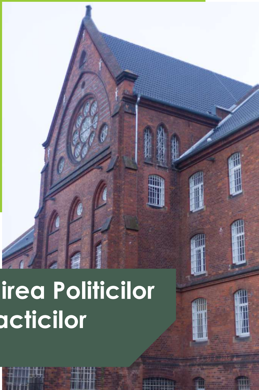
Figura 1 Închisoarea Bremen, Germania

European Career Counselling Guidelines for Staff Working in Criminal Correctional Justice System - CCJ4C - No. 12883-EPP-1-2019-1-RO-EPPKA3-PI-FORWARD, financed by ERASMUS + programme.